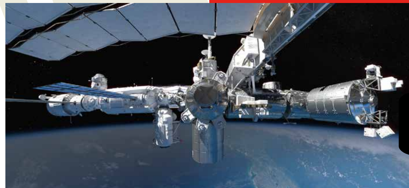
Space Explorers: New Dawn , Félix Lajeunesse, Paul Raphaël

experiences. We are committed to the public, the market and the institutions to spread the culture and the features of this new communication language. The goal of Proxima Milano is twofold: raising public awareness on the quality that can be achieved today and showing the existence of a real market for this kind of content. Ultra Reality highlights the ecosystem of producers, creators and distributors who are giving life to some of the most beautiful immersive experiences currently available.