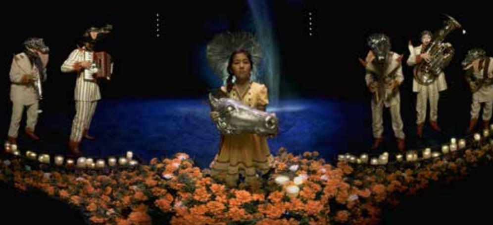
Through the Masks of Luzia , Félix Lajeunesse, Paul Raphaël, François Blouin